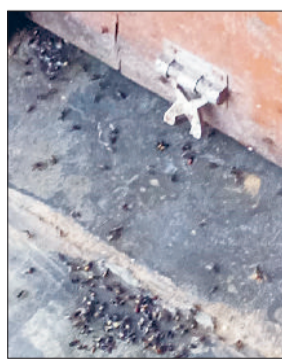
गांव केरू क्षेत्र में बसी दाणी झेरोवाली के मकान में पड़ी मक्खियां।