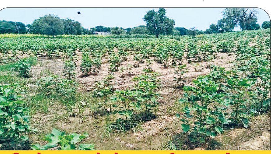
बारिश के बाद इलाके में लहलहाती कपास की फसल