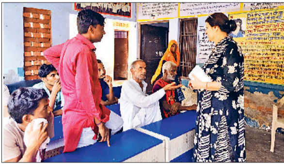
बवानीखेड़ा के एक स्कूल में अभिभावकों से बातचीत करती प्राचार्या व भिवानी के एक सरकारी स्कूल में पीटीएम के दौरान बच्चों व अभिभावकों को संबोधित करता एक वक्ता।