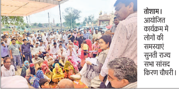
तोशाम। आयोजित कार्यक्रम में लोगों की समस्याएं सुनती राज्य सभा सांसद किरण चौधरी।

राज्यसभा सांसद किरण चौधरी ने आमजन का आह्वान करते हुए कहा कि वे पानी की कीमत को समझें। पानी की एक-एक बूंद कीमती है। ऐसे में पानी को व्यर्थ ना बहाएं और बरसात के पानी का संरक्षण करें। उन्होंने कहा कि सभी नहरों में पानी आ गया है। सबसे पहले जलधरों में पानी भरा जाएगा ताकि प्रत्येक नागरिक को पीने के लिए स्वच्छ जल मिले। उन्होंने कहा कि लोगों की भलाई और विकास कार्यों के लिए वे राजनीति में आई हैं। सांसद किरण चौधरी ने शनिवार को गांव